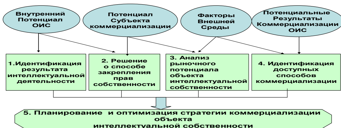
Рисунок 2 Идентификация основных стратегических этапов выбора стратегии коммерциализации на основании, факторов, влияющих на процесс коммерческого использования объектов интеллектуальной собственности